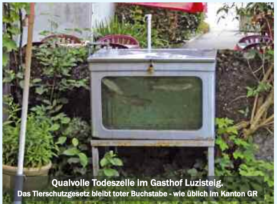
Qualvolle Todeszelle im Gasthof Luzisteig. Das Tierschutzgesetz bleibt toter Buchstabe - wie üblich im Kanton GR