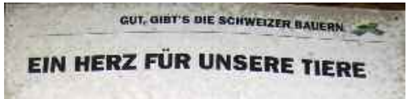
Heuchlerisches Plakat auf dem Landwirtschaftsbetrieb Plankis

Ein Leser schickte dem VgT den folgenden vom Bündner Tagblatt unterdrückten Leserbrief (Name der Redaktion bekannt). Einmal mehr veröffentlicht der VgT, was andere Medien totsichweigen: