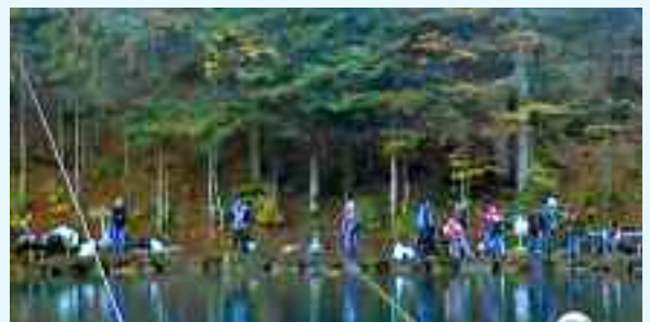
Grausamer, gedankenloser Familienplausch an einem „Bio“-Fischteich (Blausee)

fischen an, wo jedermann, der keine Ahnung vom Fischen hat, eine gemietete Angel in den vollen Teich halten und sofort ein Opfer herausziehen kann. Ganze Familien mit Kleinkindern verbringen so ihre originellen Sonntage. Wir haben schon oft darüber berichtet.