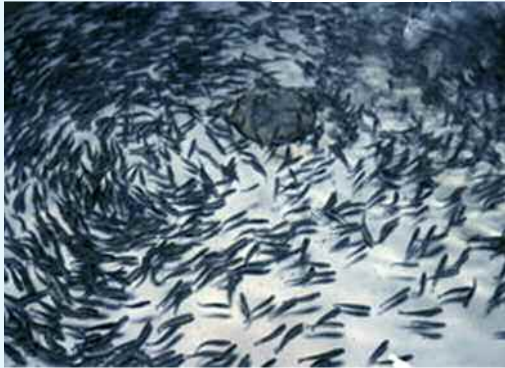
Forellenzucht Schwendi: In der Enge der Intensivhaltung schwimmen die Forellen stereotyp im Kreis.

Bei diesem sogenannten Familien-Fischen brauchen Gross und Klein nichts vom Fischen zu verstehen und Geduld braucht es auch keine. Eine gemietete Angel in den mit Fisch gefüllten Teich zu hängen, wo sofort ein Opfer anbeisst, das kann jeder, auch der Kleinste der Familie, der noch kaum gehen kann. Umso stolzer schauen hirnlose und verantwortungslose Väter der Tierquälerei zu.