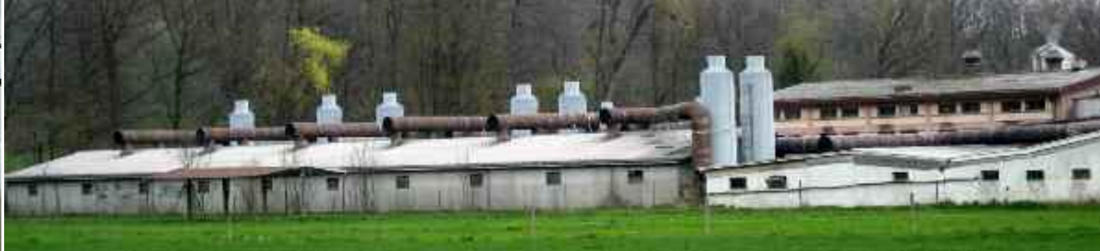
Die nachfolgenden Aufnahmen sind aus dieser Schweinefabrik in Biel-Benken