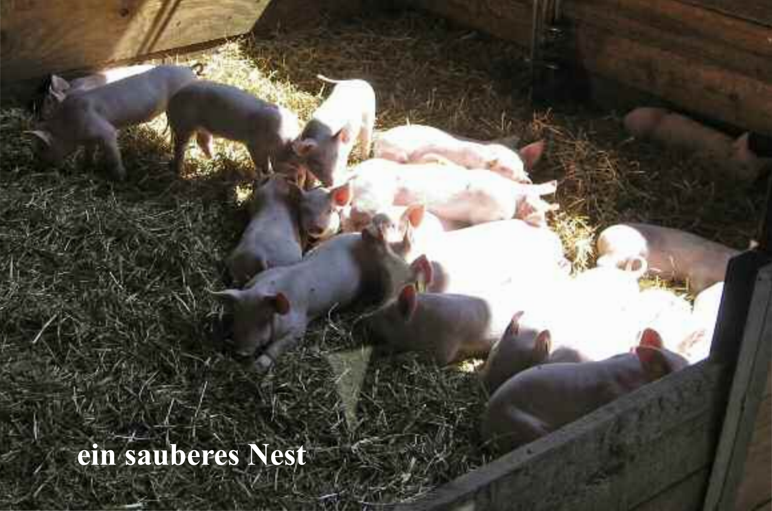
ein sauberes Nest