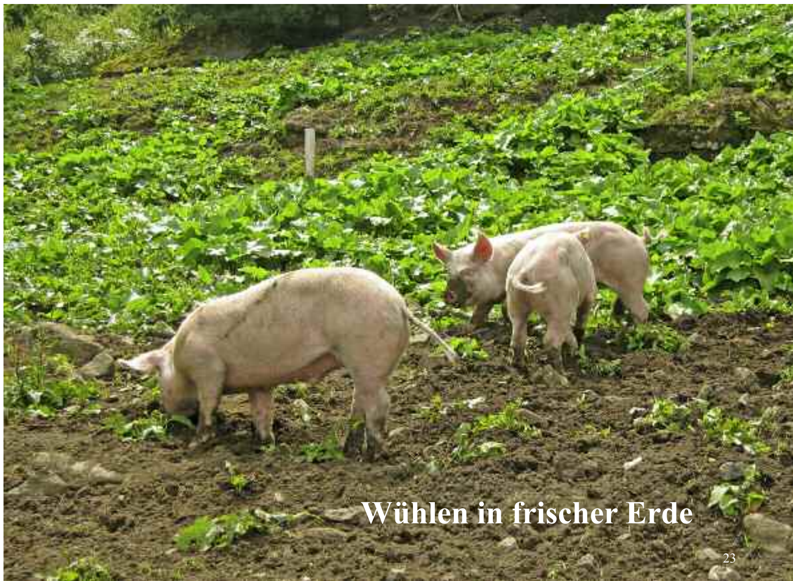
Wühlen in frischer Erde