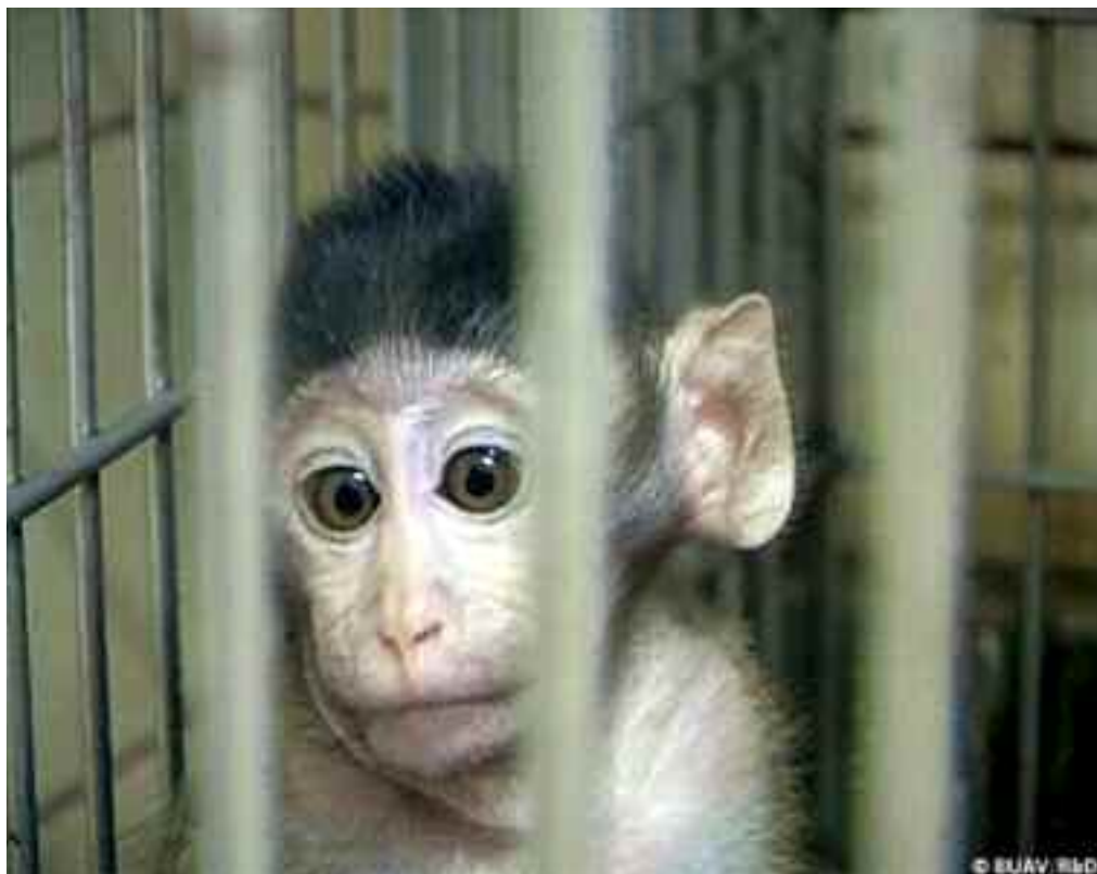
Tierversuchskonzern Covance - Novartis ist hier Kunde

Tierversuche werden nicht nur für die Suche nach neuen Wirkstoffen durchgeführt, sondern auch für das Zulassungsritual für neue Medikamente. Ich spreche bewusst von „Ritual“, denn es handelt sich um ein scheinwissenschaftliches Prozedere, das zwischen den Pharmakonzernen und den Zulassungsbehörden abgemacht wurde, um im Falle von schweren Nebenwirkungen der neuen Medikamente sagen zu können, die vorgeschriebenen Prüfungen seien durchgeführt