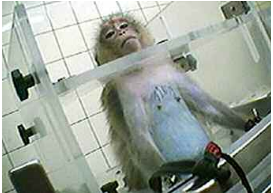
Tierversuchskonzern Covance - Novartis ist hier Kunde