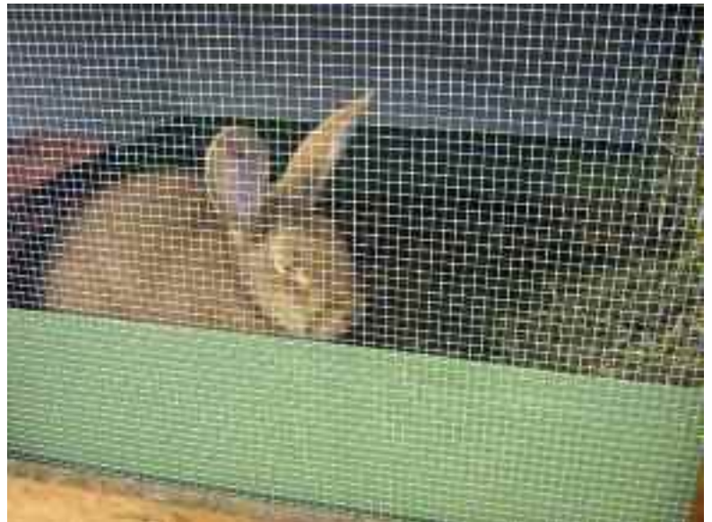
Totale Einsamkeit - grausame Einzelhaltung

Theodor Bonetti-Augustin, Stradun, 7550 Scuol www.vgt.ch/news/100416-kanin-scuol-bonetti.htm