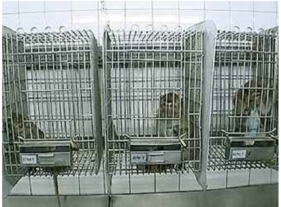
Tierversuchskonzern Covance - Novartis ist hier Kunde

Eine Studie des Schweizerischen Nationalfonds hat kürzlich aufgedeckt, dass auf dem Markt befindli-